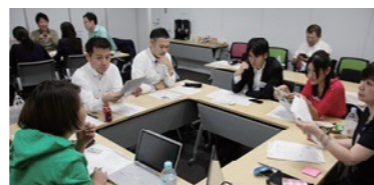
「実践広告塾」グループワーク