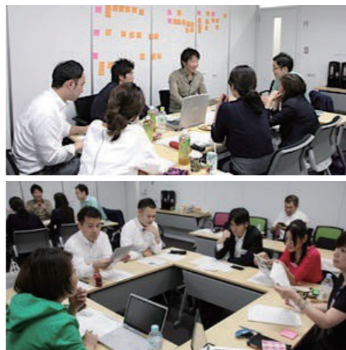
実践広告塾 グループワーク

経験豊富なトップのマーケターやクリエイターがより実践的かつ実務に役立つ事例や取り組みを紹介する、広告宣伝実務経験3年未満の中級者を対象とした講座です。合計8日間にわたる充実したプログラムが特徴で、講師陣は各企業の広告宣伝セクションの最前線でご活躍されている方々ばかりです。豊富な事例に基づくバラエティ豊かなカリキュラムは、他では聞くことができない「ここだけ話」が盛りだくさんとなっています。