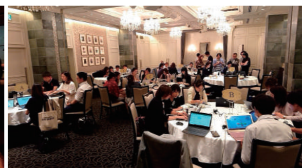
実践広告塾 グループワーク発表会