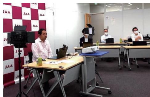
オンラインセミナー配信風景

旭化成、アデランス、NTTドコモ、大林組、カゴメ、鹿島建設、小林製薬、コニカミノルタ、サントリー、資生堂ジャパン、集英社、ソニーマーケティング、損害保険ジャパン、DeNA、帝人、東京海上日動火災保険、東芝、日産自動車、日本航空、日本電気、ハウス食品グループ本社、日立製作所、富士フイルムビジネスソリューション、三井物産、Mizkan、三菱地所、三菱電機、明治、ユニ・チャーム、養命酒製造、リコー、リクルート、ローソン、ロート製薬、ロッテ ほか多数。