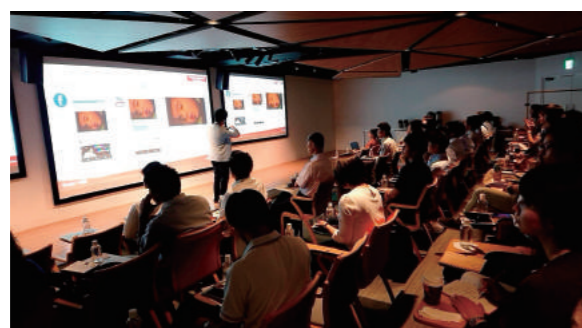
実践広告塾 Google見学会